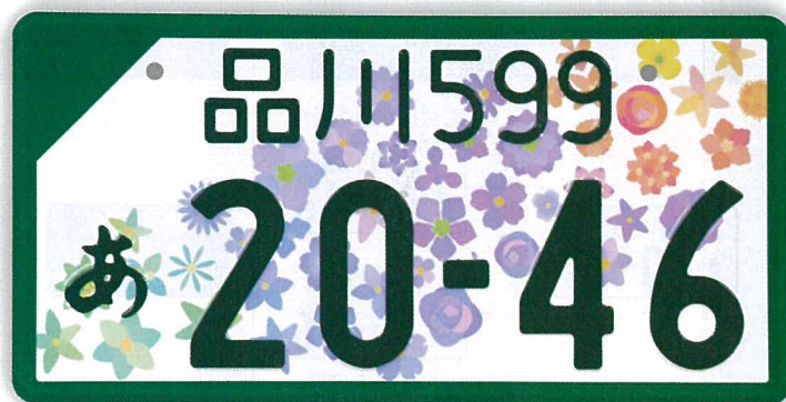
登録自動車(事業用)