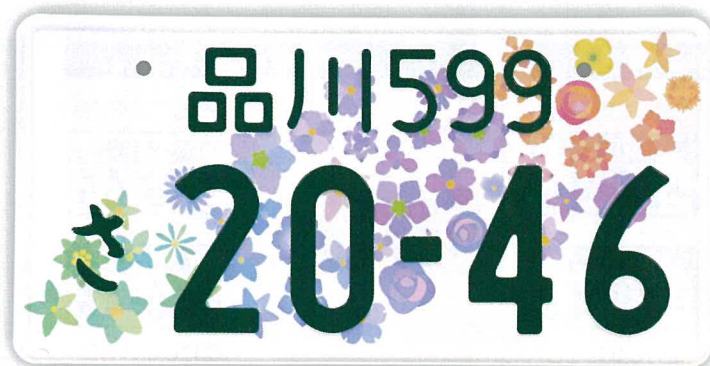
登録自動車(自家用)